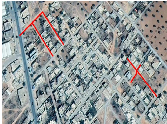
Quartier Alajenna charkia